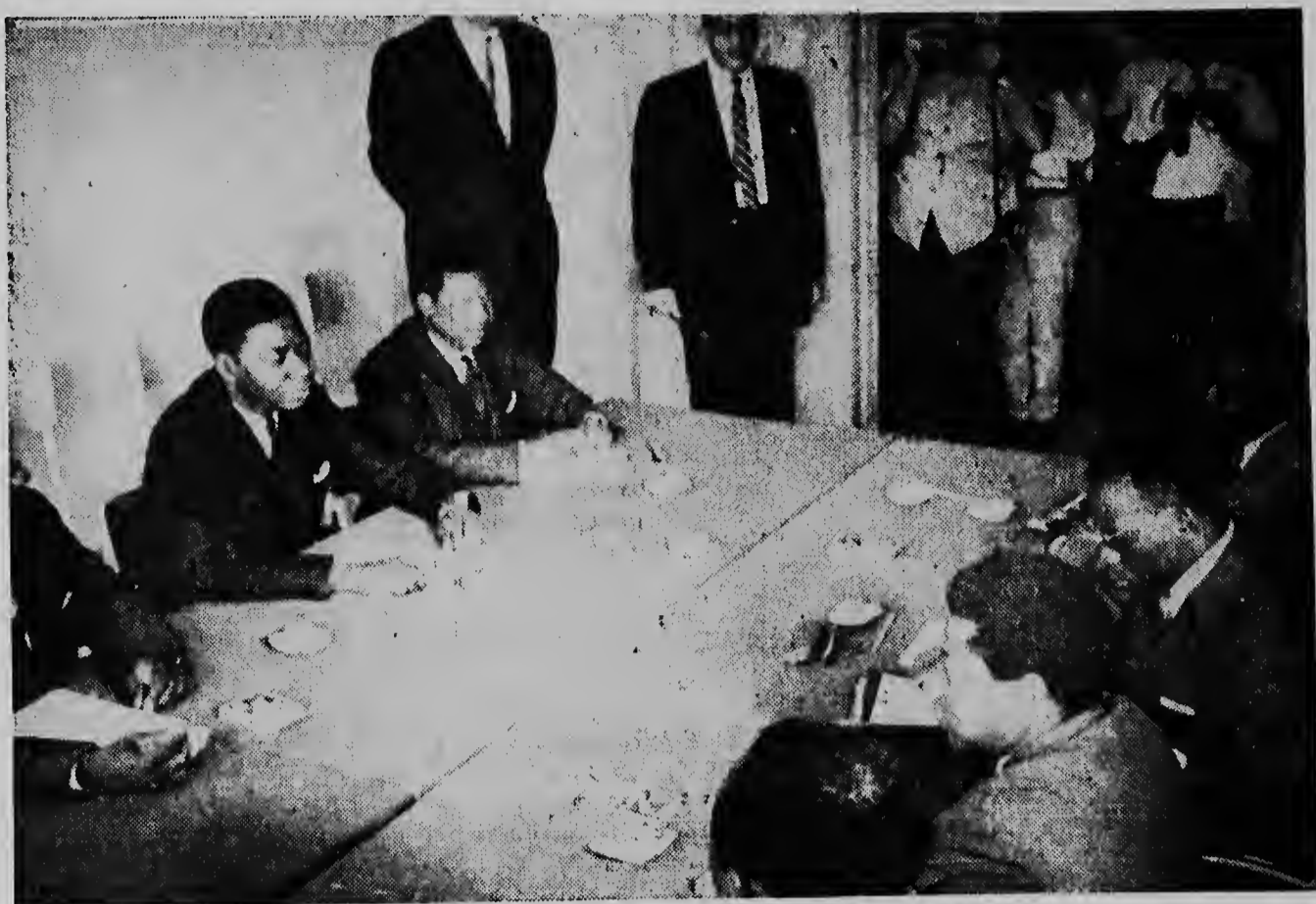
Esquí ta un bista dje conferencia en a tuma luga na Kitona entre president Tsjobbe y premier Adoela. Riba e portret aquí nos ta mira Chombe sinta en frente Adoela y banda di esquí ta sinta Bombako, e ministro Congoles di asuntoun exterior.